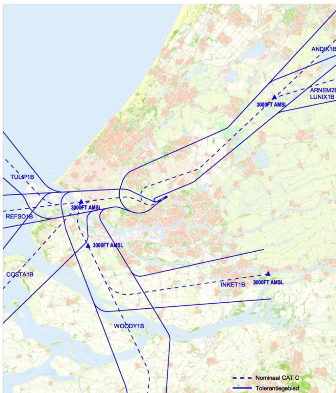
2 Tolerantiegebieden starts baan 24